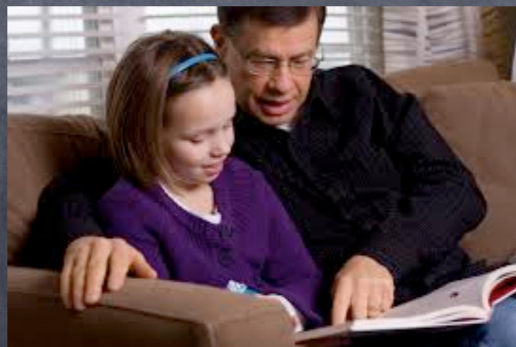
Parent qui lit