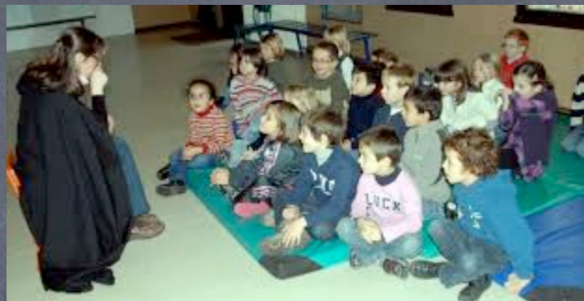
Enseignant qui conte ou qui lit