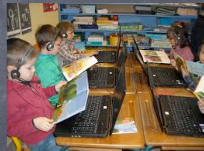
Elèves écoutent un conte