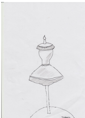
Dessin créé par Rhéane et Maïwen

Chaque cirque ou presque a une costumière qui dessine et coud les costumes des artistes.